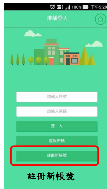
手機 Android 版