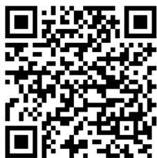
手機 iOS 版