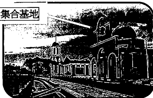
新竹騎跡 集合基地